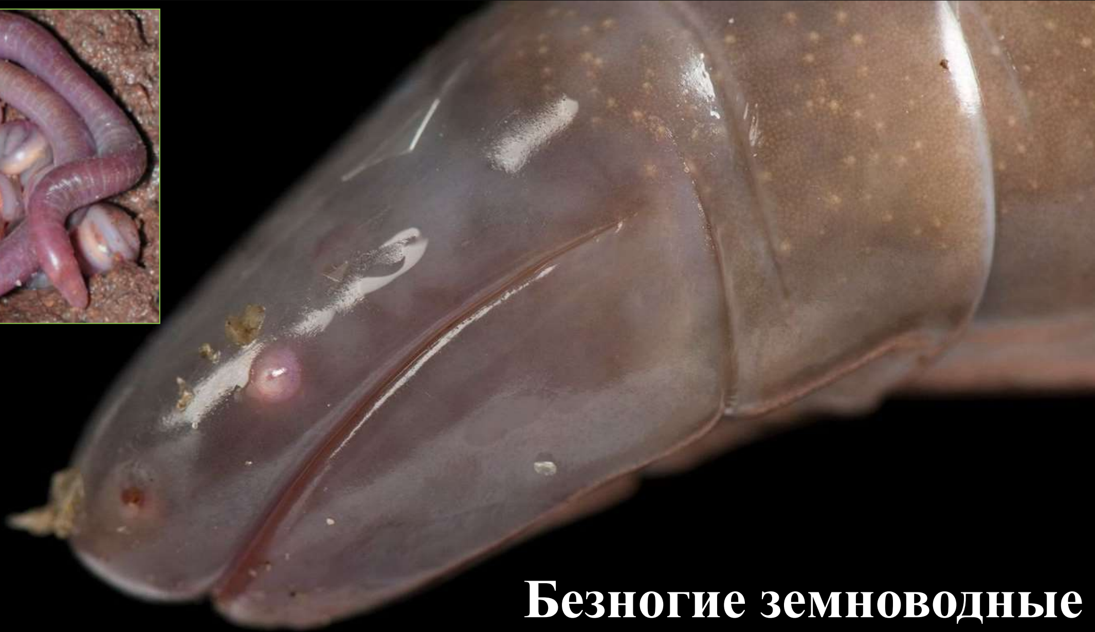
Безногие земноводные Gymnophiona Müller, 1832